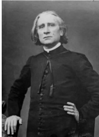
Franz Liszt (1811-1886)

Por el eterno descanso del hermano franciscano Liszt Ferenc