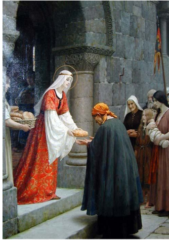
E. Blair Leighton, La carità di Santa Elisabetta d'Ungheria